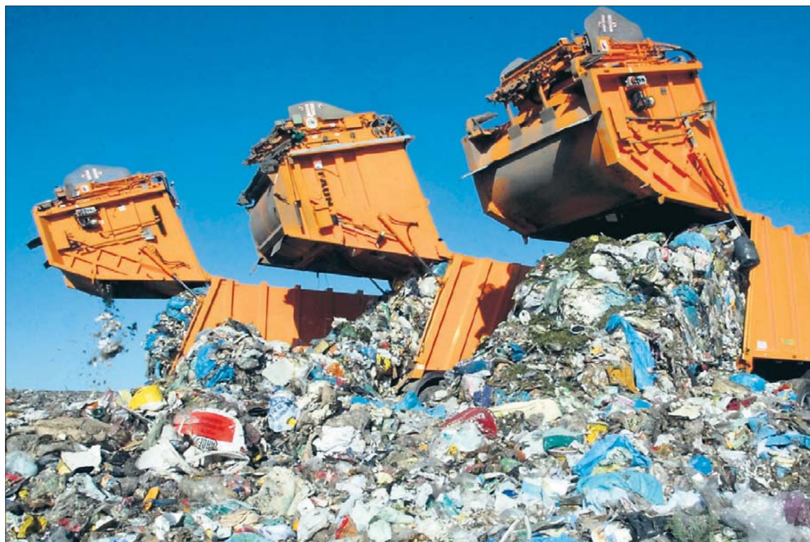
In Müllhalden laufen unzählige chemische Prozesse ab. Oft entweicht dabei Methan, ein brennbares, klimawirksames Gas. Dieses war bislang nur in höheren Konzentrationen als Energieträger nutzbar. Ingenieure haben nun einen Brenner entwickelt, der ein Luftgemisch mit nur 15 Prozent Methan verbrennt. Auf diese Technik hoffen nun auch die Betreiber von Biogasanlagen.